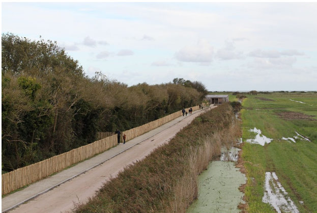
Chemin d'accès piétonnier au grand observatoire de la Réserve de Beauguillot

Malgré tout, une portion de ce chemin est accessible en empruntant, à pied, la partie goudronnée et sécurisée au moyen de plots en bois qui longe la D329. Il mène aux deux observatoires de la partie Nord, qui est en expérimentation afin d'étudier le comportement des oiseaux hivernants face au public. Ce chemin (tracé orange sur le schéma ci-dessus) ne sera donc ouvert, pour l'instant, que de façon ponctuelle lors de la présence d'un agent chargé de surveiller et accompagner le public sur cette portion seulement.