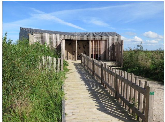
Le grand observatoire de la Réserve de Beauguillot

Les chemins sont uniquement piétons et des barres pour accrocher les vélos ont été mises en place sur le parking principal.